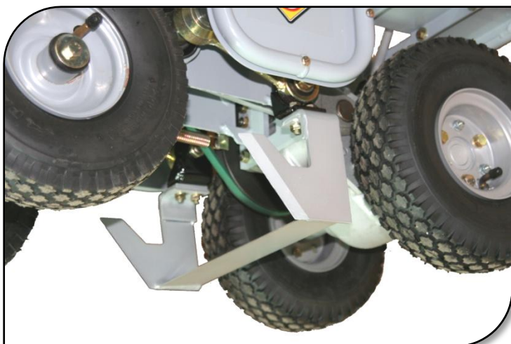
Snijmes makkelijk te vervangen