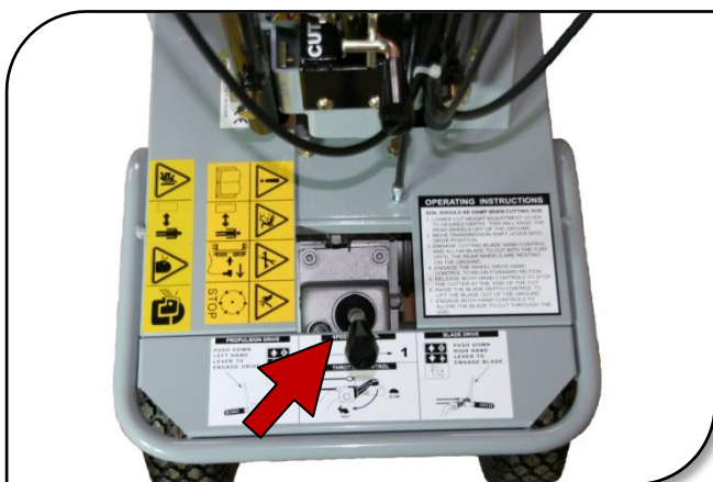
Hoge en lage versnelling d.m.v. schakeling hendel