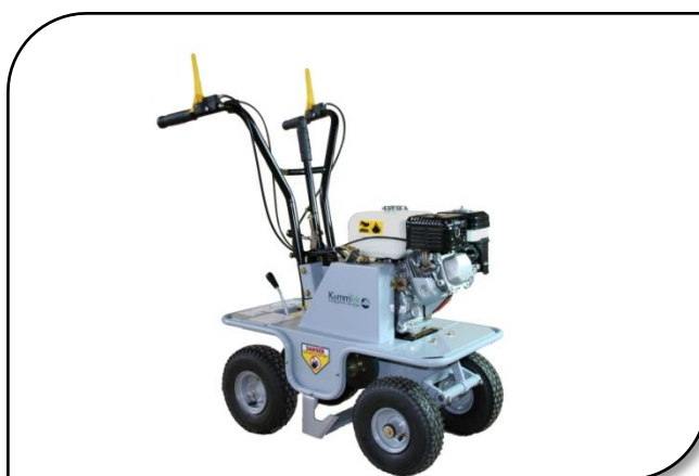
Compacte lichtgewicht machine